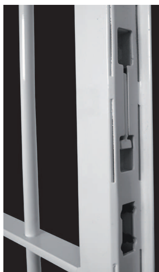
Uppe & nere på pargrind och vikgrind.