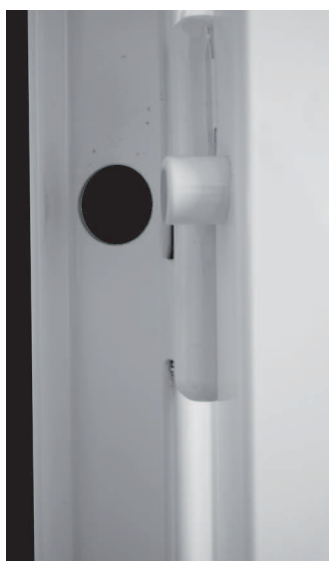
3 styck per gångjärnssida.